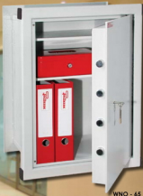
WNO - 45